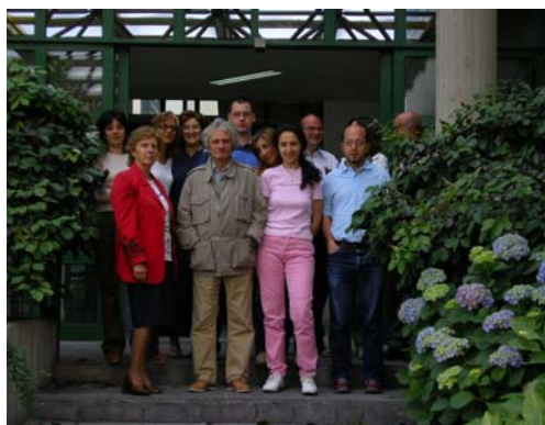
Autori del Notiziario Informativo della Provincia di Benevento