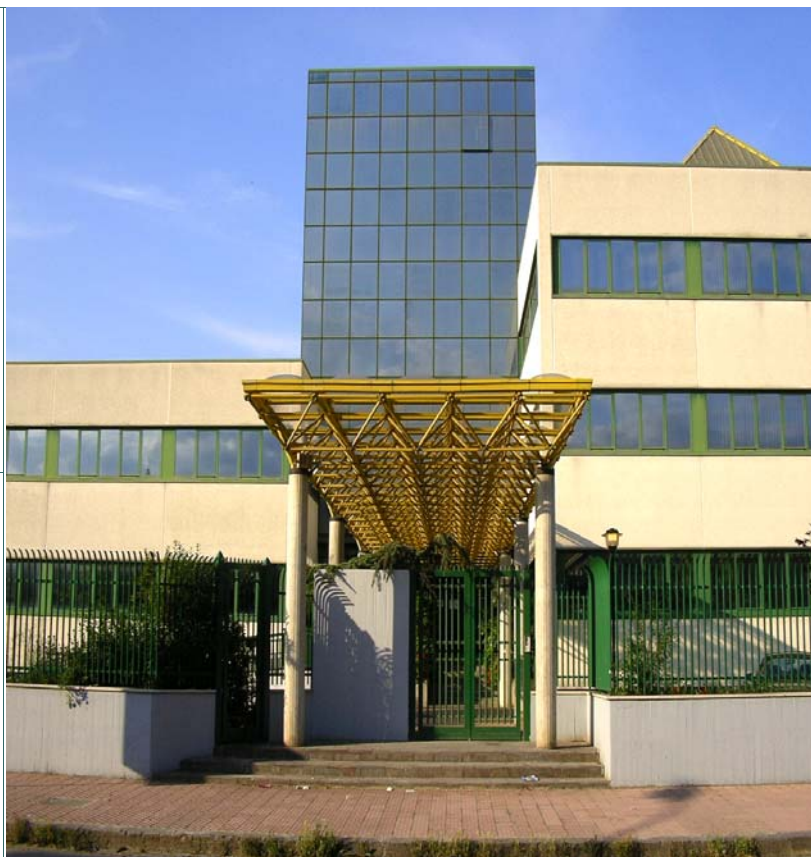
Sede dell'Assessorato al Lavoro – Centri per L'Impiego

Il Notiziario viene realizzato presso il Centro per l'Impiego di Benevento Via XXV Luglio, 14 82100 – Benevento Tel.: 0824/774703 – 774683 Fax: 0824/326624 E-mail: serviziocpi@virgilio.it