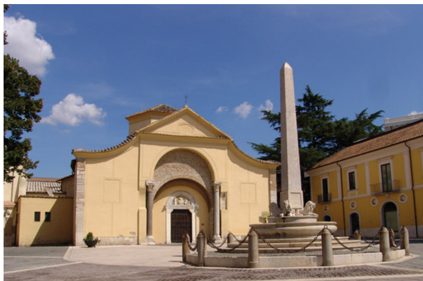
Chiesa di S. Sofia – Patrimonio Unesco