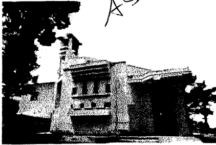
Parrocchia San Bartolomeo Ap. Monterocchetta - S. Nicola M. (BN)