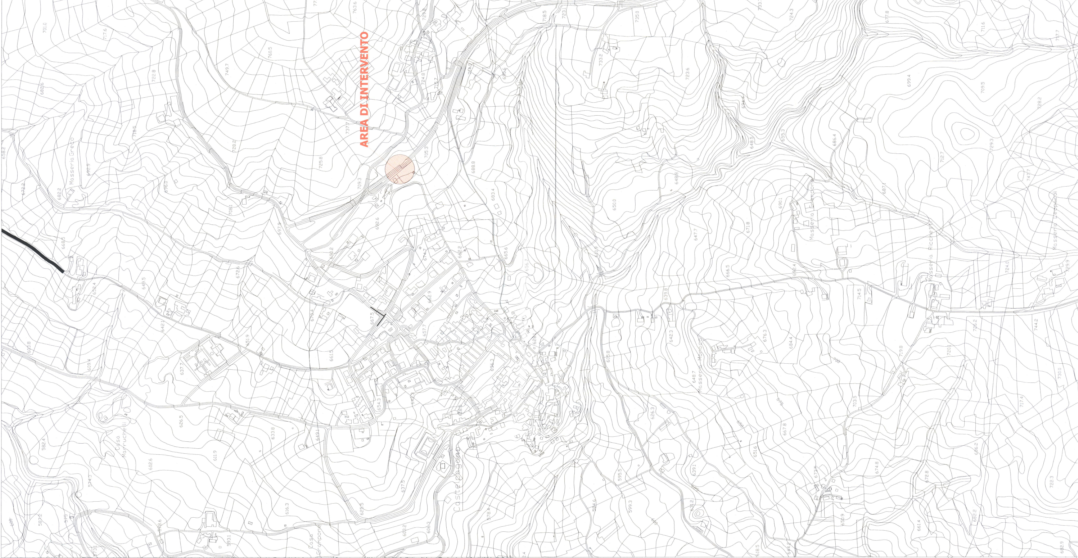
AEROFOTOGRAMMETRIA SCALA 1:10.000