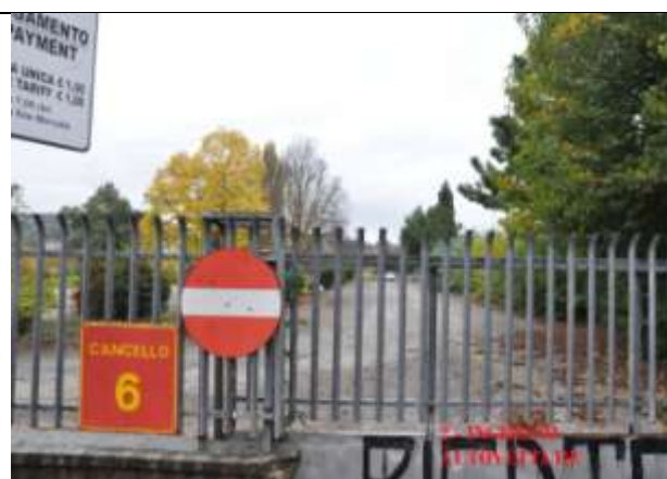
2 – Ingresso Cancelli 6