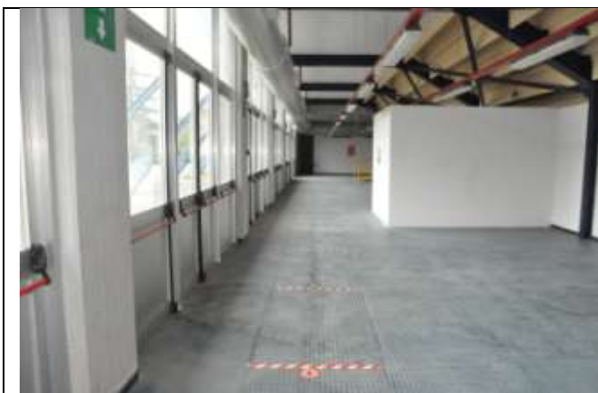
5 – Area di percorrenza Elettori