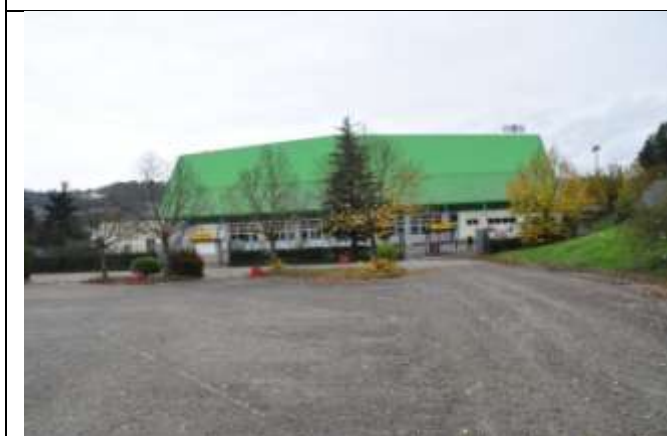
3 – Area parcheggio lato ovest