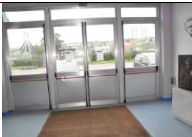
6 – Uscita Elettori