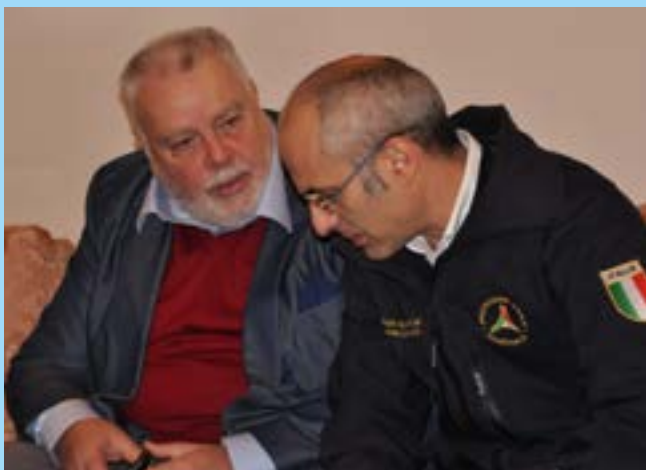
Ricci con il Capo della Protezione Civile Fabrizio Curcio

Se non ci fosse stato quello sbarramento artificiale, che impedì il deflusso a valle di quella immensa massa d'acqua, probabilmente la stessa Città di Benevento sarebbe stata quasi per intero travolta dalla piena dello stesso Tammaro e del