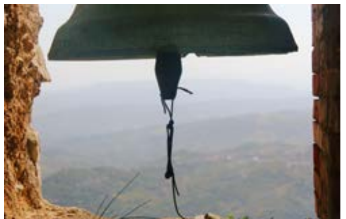
La Campana dell'Eremo di San Michele

La processione discende e la statua viene collocata nella cappella della Madonna delle Grazie, in Barassano, per riprendere nel pomeriggio e ritornare nella chiesa di Santa Maria di Costantinopoli.