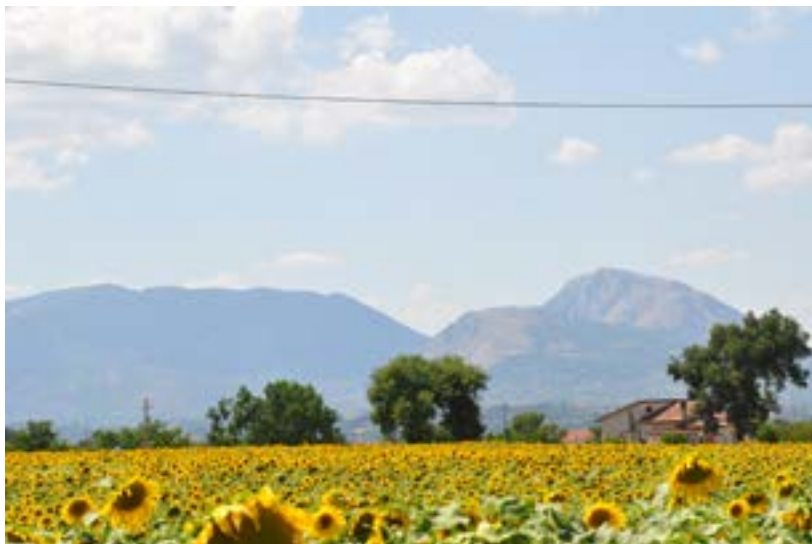
La gran Dormiente del Sannio

Quanto alla banda larga, strumento essenziale per garantire servizi al territorio e migliorare la qualità della vita dei cittadini, a partire dalla telemedicina, è il caso sottolineare come resti in tutta la sua gravità il tema "dell'ultimo miglio", cioè del collegamento casa per casa dalla condotta principale che taglia fuori numerosi piccoli centri.