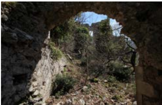
Per salvare dalla totale distruzione il Monastero si pensa di utilizzare i fondi del PNRR