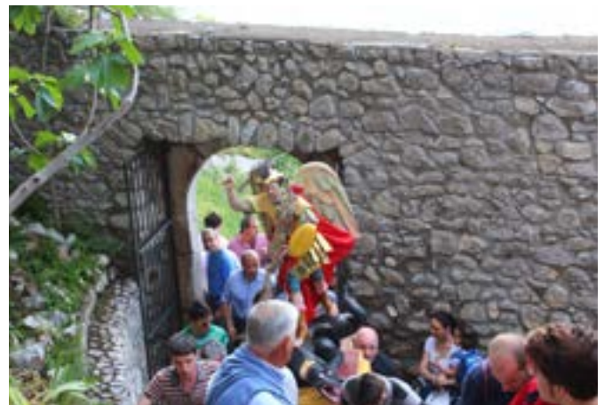
I fedeli accompagnano la Statua di San Michele