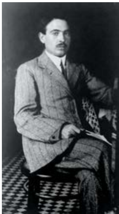
Autoritratto allo specchio di Nicola Ciletti, negativo su lastra in vetro cm 18x12, 1915 circa

quentato la scuola tecnica di Benevento s'iscrive alla scuola delle belle arti di Napoli. Nel 1903 partecipa a Napoli "con riuscitissimi studi di animali" alla Promotrice Salvator Rosa, esposizione del Circolo artistico partenopeo.