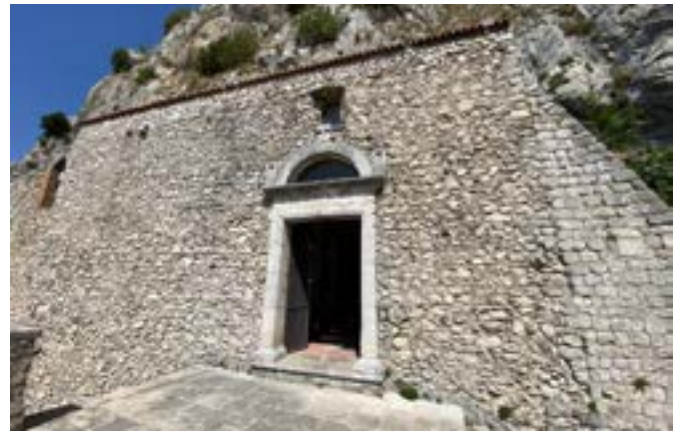
La Chiesa dell'Eremo