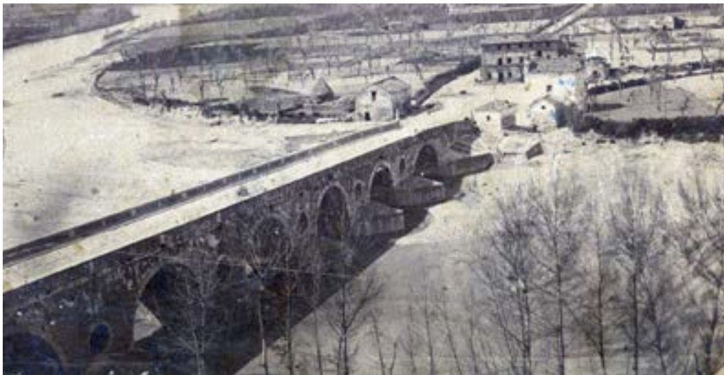
Immagine ante guerra del ponte sul fiume Calore

Al ché, verrebbe da dire, che senso ha parlare ancora di questo ponte? In effetti, la questione del ponte, o dei ponti, sul Calore è un rebus storico che ancora non mette tutti d’accordo.