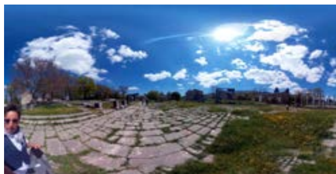
L'area archeologica di Altifilia-Sepino (CB), Sannio Molisano

Per presentare all'opinione pubblica teutonica gli "attrattori turistici" di maggiore rilevanza del territorio sannita, il Consolato Generale Italiano di Monaco di Baviera, insieme ad ENIT-Agenzia Nazionale del Turismo hanno promosso un'iniziativa d'incoming rivolta a testate giornalistiche tedesche specializzate sul turismo.