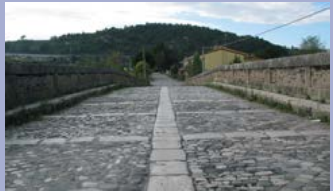
Benevento: Il ponte Leproso sulla Via Appia.

In basso: "Il ponte Leproso sul fiume Sabato a Benevento", acquerello di Carlo Labruzzi (Roma 1747 - Perugia 1817), realizzato durante il viaggio lungo la "Regina Viarum" intrapreso con Sir Richard Colt Hoare nell'ottobre del 1789