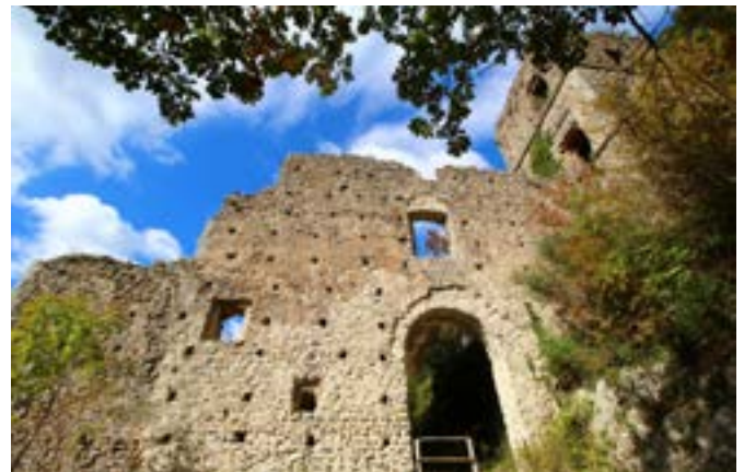
Rovine del Monastero eretto, secondo alcune fonti, dal Principe longobardo di Benevento Atenolfo I nel sec. X; altri fissano la data di fondazione molto più tardi e cioè al 1164.

di 200, a seguito di alterne vicende nel 1882, per lasciare nel tempo ai posteri testimonianze di spaccati esistenziali in una dimensione spirituale con risvolti socio-culturali. Della serie documentale, conservata in Napoli, solo alcune pergamene riguardano il Monastero di Santa Maria in Gruptis,