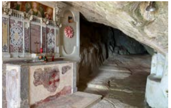
Particolare della Grotta di San Michele