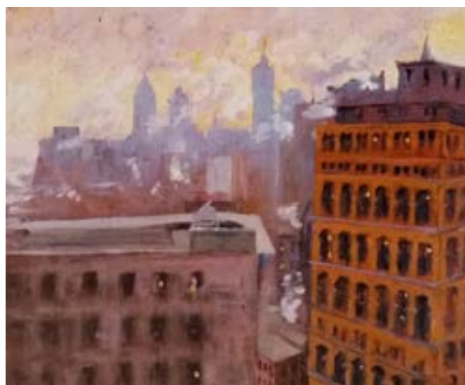
Grattacieli a New York: una delle poche foto superstiti dell'archivio di Nicola Ciletti scampate ai bombardamenti del 1943 su Benevento