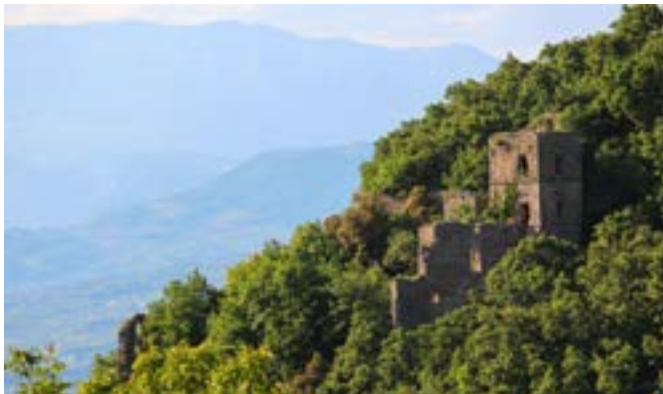
Il Monastero di S. Maria della Grotta aggrappato sul versante del Monte Drago nel Massiccio del Taburno Camposauro

Ciò che è rimasto del fondo pergamenaceo del Monastero di S. Maria della Grotta, risalente ai secoli XI-XII, custodito nella Biblioteca della Società Napoletana di Storia Patria, racchiude la memoria del passato di un luogo dove nel silenzio dominante e lontano dalle distrazioni mondane, i monaci hanno ascoltato la voce di Dio, ruminando la sua Parola tra la suggestiva natura di incomparabile bellezza.