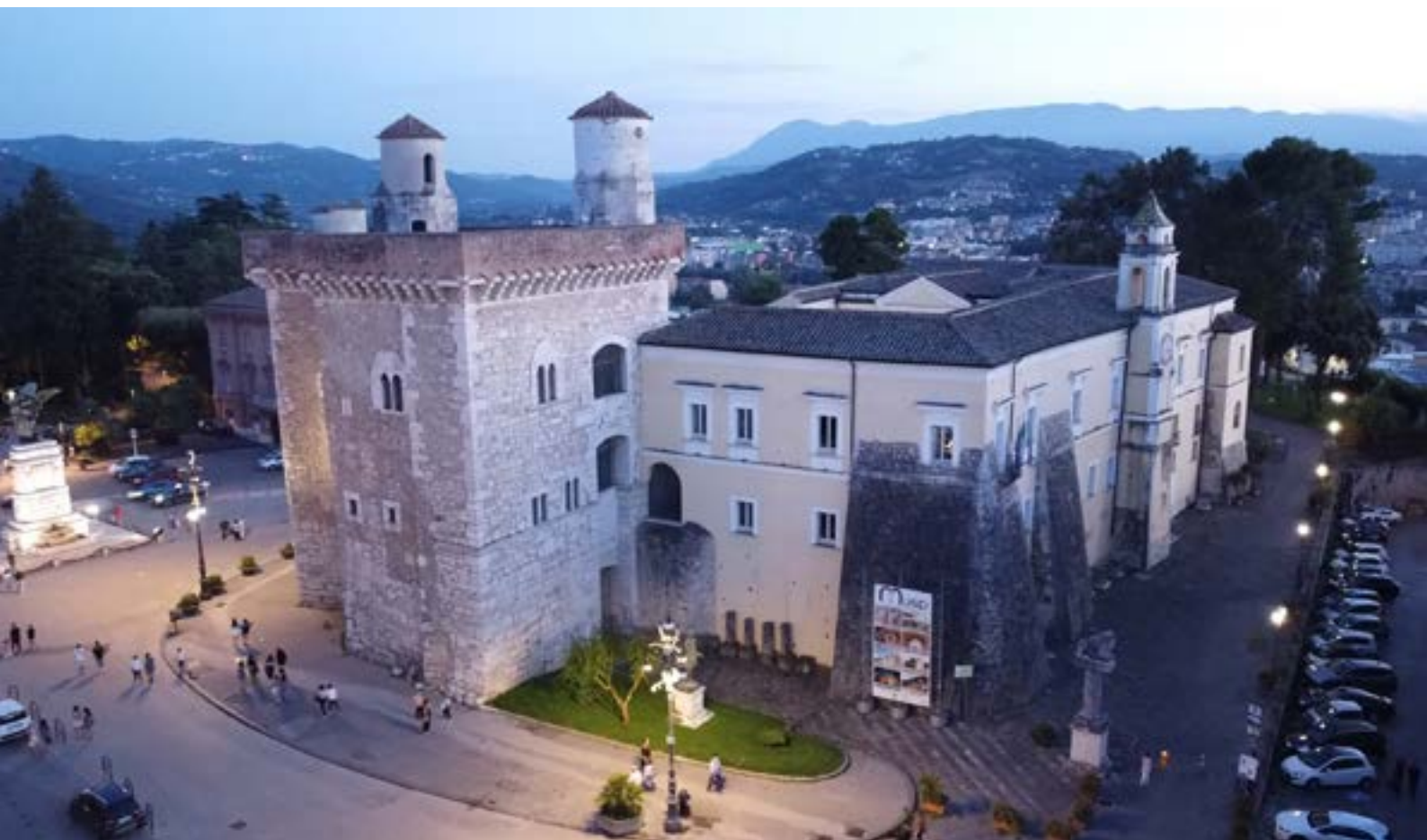
Piazza Castello - Benevento

produzione di energia da fonti alternative.