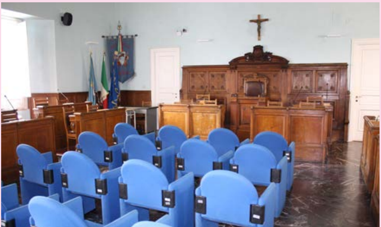
La Sala del Consiglio Provinciale della Rocca dei Rettori

Egual rilievo è stata la presenza e la decisionalità della Provincia sulla vicenda della Diga di Campolattaro per oltre 500milioni di Euro per le opere irrigue e civili a favore di tutto il Sannio.