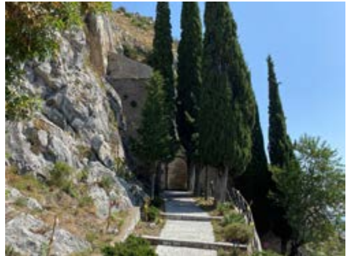
Ingresso all'Eremo di San Michele

Per i lettori riporto una lunga tradizione di studiosi, che hanno pubblicato notizie sull'anno di fondazione del luogo di culto micaelico, tra cui: F. PEDICINI, La Valle Vitulanese e S. Menna Solitario , Bari 1883, passim e in particolare le pp. 8; 132; A. MEOMARTINI, I Comuni della Provincia di Benevento , cit.,