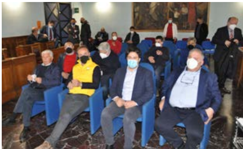
I partecipanti al Summit

A seguito di questo lavoro e dopo ulteriori intese fu elaborato un protocollo d'intesa datato 28 luglio sottoscritto il 3 agosto successivo dai Soggetti coinvolti nel confronto per gli interventi funzionali, atti ad accrescere la disponibilità d'acqua