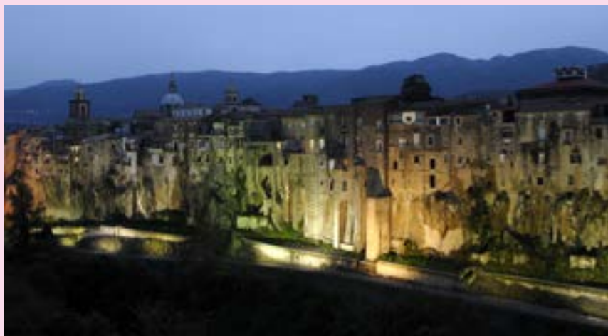
Una veduta di Sant'Agata de' Goti

Nel corso degli anni, rispetto ai lotti in esercizio, la Provincia di Benevento ha dato corso a numerosi interventi per completare lo sviluppo complessivo dell'asse viario principale, grazie a finanziamenti del Comitato Interministeriale per la