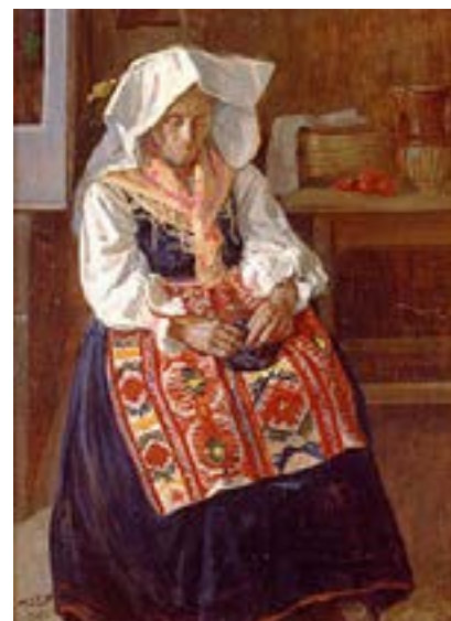
Contadina di San Giorgio la Molara

Ma ancor più quella romana, il settimanale d'Arte Roma "Fiamma" il 13 giugno 1924 scrive: "non si affatica ai problemi letterari della tecnica: egli dipinge". La recensione, nel certificare con puntualità la portata dell'artista, ne coglie la spontaneità, tutt'altro che faciloneria, e ne definisce l'intensità, ribadendo che il Ciletti "sa dipingere come