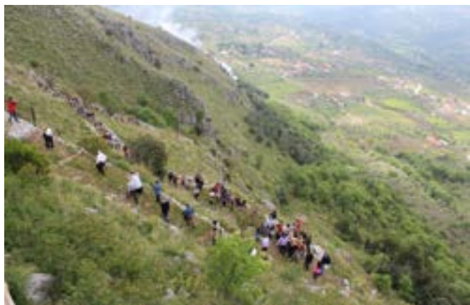
I fedeli risalgono i tornanti del Monte Caruso per accedere all'Eremo dedicato all'Arcangelo

Le origini della sua fondazione sono state riportate da ricercatori locali, esse non hanno alcuna veridicità documentale prima dell'anno mille. Riporto una lunga tradizione di studiosi che hanno pubblicato notizie sull'anno di fondazione della badia, tra cui: F. PROCACCINI, Gli atti di S. Menna eremita , Napoli 1883, in particolare le pp. 17-18; 32-33; F. PEDICINI, La Valle Vitulanese e S. Menna solitario , Bari 1883, passim e in particolare le pp. 8; 133; 48-49; MEOMARTINI, I Comuni della Provincia di Benevento , cit., pp. 229-230; MARCARELLI, L'Oriente del Taburno , p. 14 passim e in particolare le pp. 81 - 86; V. MAZZACCA, Cronaca di un convento (S. Maria della Strada presso il Calore secc. XVII-XVIII) . Notizie su S. Maria in Gruptis , Benevento 1983, pp. 189-210. 24 Ferdinando Ughelli afferma che l'abbazia fu edificata nel 940 da Atenolfo I principe di Be-