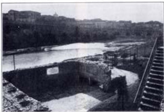
BENEVENTO, Ponte della Maorella