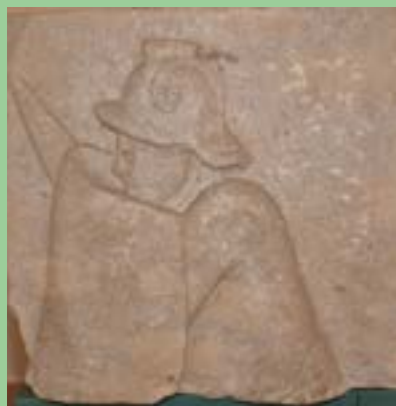
"Il Gladiatore sannita", uno dei "tesori" dell'Epoca romana di Benevento