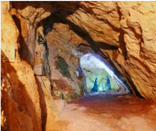
Particolare della Grotta di San Michele