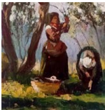
La raccolta delle olive

Intanto il ritorno a San Giorgio, dopo la non trascurabile esperienza napoletana – scrive sempre Salvatore Basile – restituisce il Ciletti alla pittura che gli è più congeniale. Paesaggi, contadini, scene e figure della campagna sangiorgese ritornano in un ormai tranquillo padroneggiamento della tecnica pittorica. Una tavolozza, ormai rinnovata,