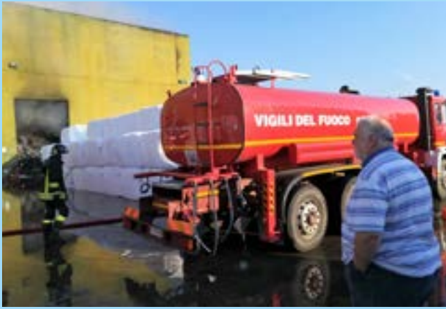
Agosto 2018 - Il Presidente Ricci presenzia alle fasi di spegnimento del devastante incendio allo STIR di Casalduni

Ricci ha esercitato il proprio ruolo di Presidente della Provincia in una stagione di acuta difficoltà dal punto di vista istituzionale, finanziario, organizzativo e dell'emergenza ambientale e climatica.