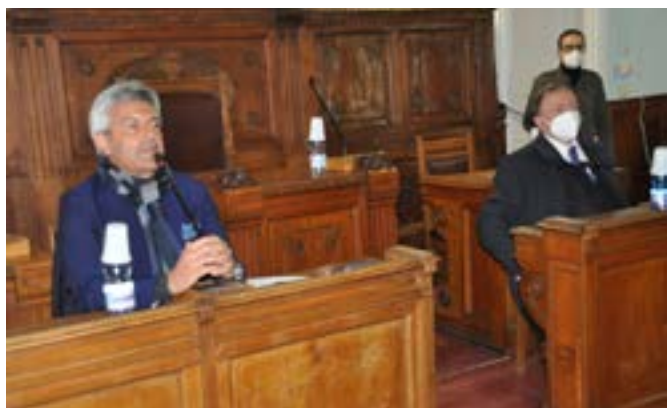
Alcuni momenti del confronto in Sala Consiliare sull'utilizzo delle acque della Diga di Campolattaro con Provincia, Regione Campania, Associazioni Ambientaliste, Sindacati Operatori Agricoli, Consorzio di Bonifica del Sannio Alifano e Organismi Tecnici

na lo studio del Consorzio Valle Telesina di alcuni decenni or sono, attualizzando sia le superficie da irrigare che i fabbisogni culturali. Secondo l'Università di Agraria di Portici che ha realizzato lo studio di settore non ci sono margini di redditività significative se si superano le quote di irrigazione di 250 metri sul livello del mare. Le superficie coltivabili in provincia di Benevento al di sotto di tale quota sono pari a 18mila