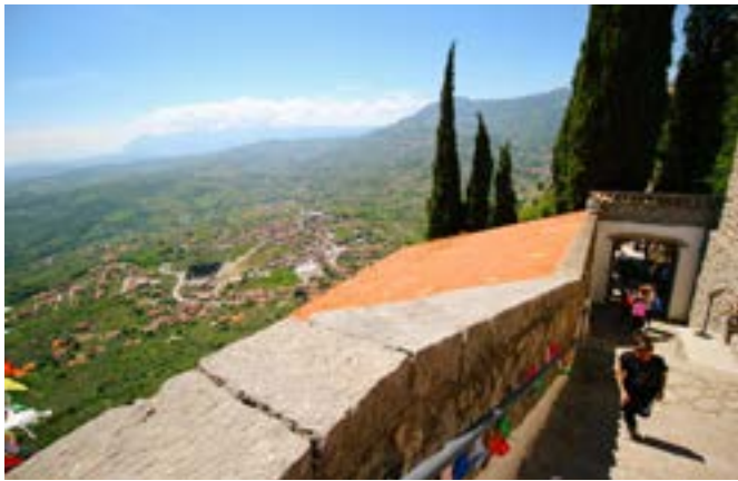
Ultima, aspra rampa per l'Eremo