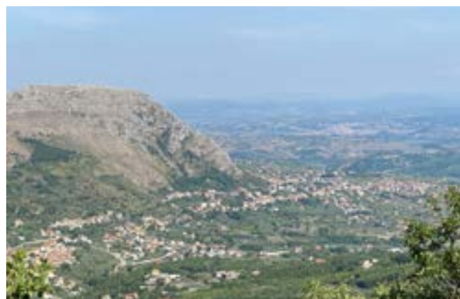
Foglianise ai piedi del Monte Caruso

La pergamena di taglio irregolare, misura mm. 244/214 x 180/175, in essa non appare la sottoscrizione del giudice, il no-