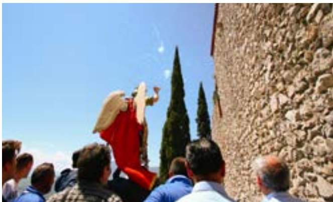
La statua di San Michele Arcangelo lascia la Chiesa

Ne lascerò di celebrar lo speco Ove il duca degli si adora: