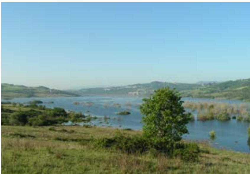
Uno scorcio del Lago artificiale tra Campolattaro e Morcone

Il progetto consta di opere di potenziamento ed integrazione dei sistemi acquedottistici della provincia sannita a servizio di un bacino di utenza di circa 200.000 abitanti: potenziamento (rifacimento) dell'adduttore per la città capoluogo, per uno sviluppo di circa 32,5 km, attraverso una condotta; adduttori