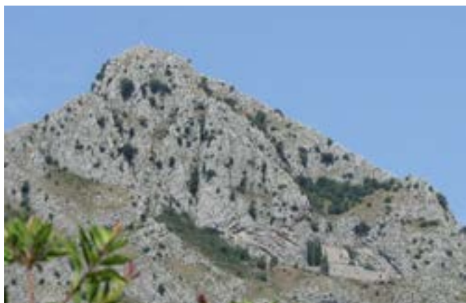
Altra immagine, ripresa dalla sottostante Strada provinciale, per l'Eremo su Monte Caruso

Dalla lettura di un manoscritto emerge che alcune pergamene risultano sfrante e disposte senza alcun ordine; manca un indice; altre, inoltre, appaiono tagliate, per incuria, certamente in passato rilegate in volumi. I documenti più antichi stati tagliati maldestramente e si scorgono delle evidenti lacerazioni su uno dei margini, estratti dai volumi con poca cura e in modo grossolano. Non è possibile datare quanto tutto ciò sia accaduto, sta di fatto che non vi sono dubbi sull'attentato alle pergamene perpetrato da uomini non attenti al patrimonio culturale di inestimabile valore.