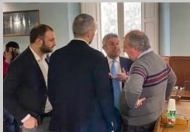
Si discute in Consiglio Provinciale sulla SAMTE. In basso l'Assemblea dei Soci del 3 febbraio 2023

La Società "Sannio, ambiente e territorio" (Samte), istituita dalla Provincia di Benevento nel 2009 a seguito del Decreto legge del Governo Berlusconi che dichiarava chiusa la stagione della emergenza rifiuti in Campania, è stata riportata "in bonis" a tre anni dalla dichiarazione di stato di liquidazione.