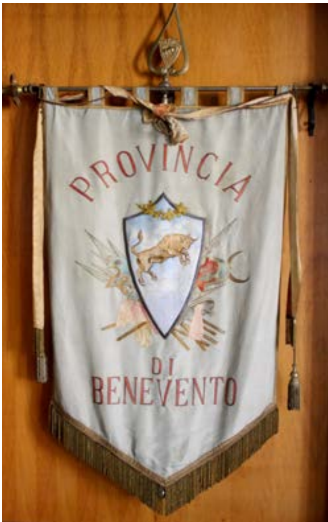
Gonfalone storico della Provincia

E' necessario realizzare una mappa del patrimonio immobiliare dismesso di proprietà della Provincia di Benevento allo scopo di mettere in atto una strategia di recupero, elaborando