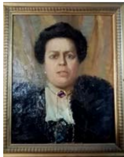
Ritratto di Matilde Serao

Non si rassegna al ruolo di provinciale e nel 1934 è presente alla XV Fiera di Milano, ospitato con una personale nel Padiglione del Consiglio provinciale dell'Economia di Benevento: circa qua-