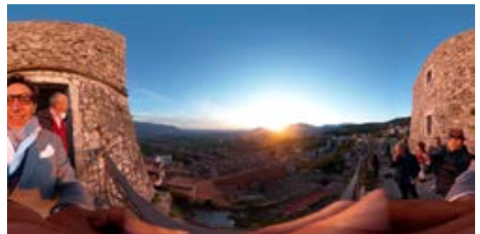
Aperitivo al tramonto sulla terrazza del castello di Guardia Sanframondi, offerto dalla cantina "La Guardiense"