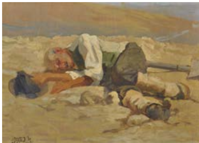
Colpo di Sole