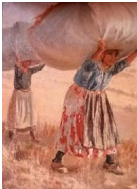
Portatrici di paglia

A Napoli in questo periodo "si è rifugiata l'ultima bohème fuga-