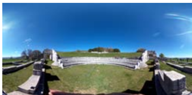
Il sito archeologico Sannita di Pietrabbondante (IS), Sannio Molisano

poco conosciuta, ma di grande attrazione dal punto di vista archeologico, storico-culturale e turistico. Artefice della intelligente promozione territoriale, il Consolato Generale d'Italia a Monaco di Baviera, nella persona del Console Generale Enrico de Agostini , originario di Campolattaro. Una mostra di valenza internazionale, che ha visto collaborare in stretta sinergia prestigiose istituzioni culturali quali il British Museum di Londra e la Bibliothek