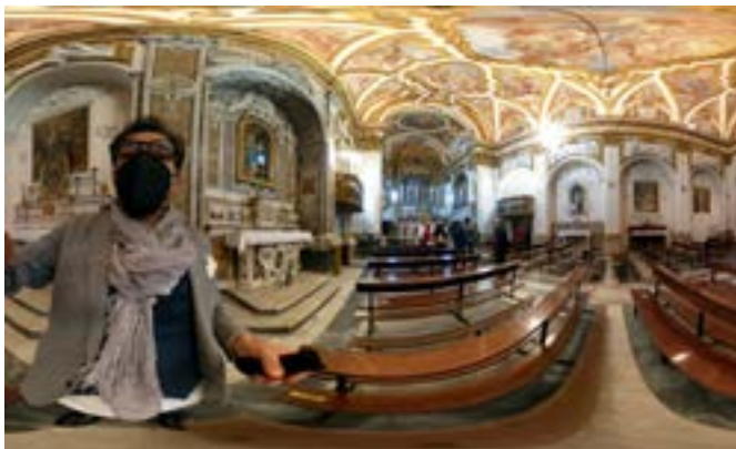
La visita alla chiesa di San Sebastiano (XVIII secolo) di Guardia Sanframondi (BN), ricca di opere d'arte.