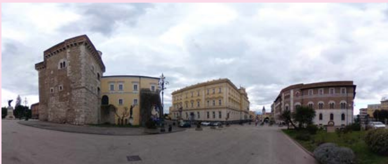
Benevento, veduta di Piazza Castello: da sx, la Rocca dei Rettori, il Palazzo del Governo, il Palazzo della Camera di Commercio

Circa la gestione di alcuni servizi alla collettività erogati dalla Provincia sostanzialmente per il tramite delle Società