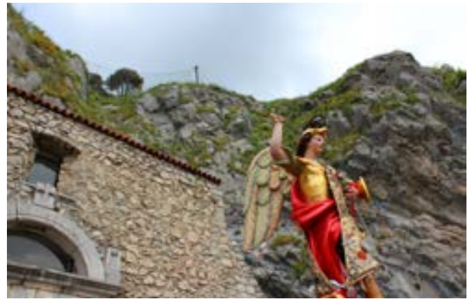
San Michele sulla terrazza dell'Eremo

della processione dopo la prima messa, celebrata nella chiesa di Santa Maria di Costantinopoli, l'aria è pervasa dalla festa.