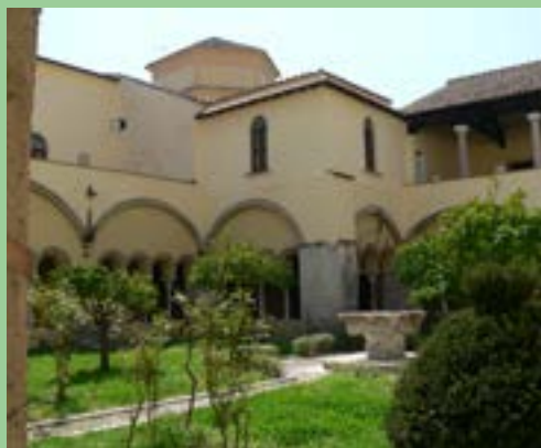
Il Chiostro di Santa Sofia su cui si affaccia il Museo del Sannio