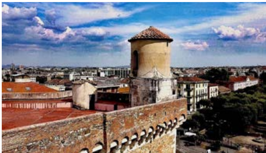
Torrione Longobardo alla Rocca dei Rettori

La pandemia ha messo a nudo le debolezze sociali, economiche e ambientali delle nostre società. Il Covid-19 ha mostrato le fragilità dell'attuale modello di sviluppo e ne ha accentuato le disuguaglianze. Partendo dalla frase di Papa Francesco "Non possiamo separare l'economico dall'umano", possiamo ben dire che la pandemia ha cambiato la concezione della nostra fragilità come individui e come sistema economico e sociale. Oggi più di ieri lo sviluppo sostenibile è diventato un imperativo. Nel definire e organizzare le poli-