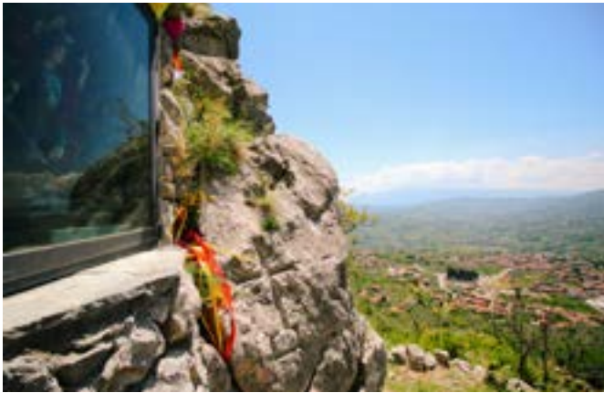
L'edicola votiva di Pietra Santa