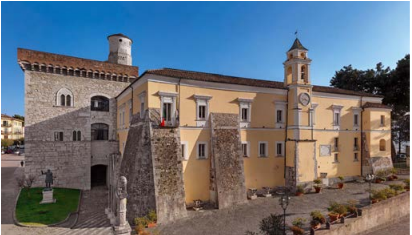
Benevento: la Rocca dei Rettori con il Torrione Longobardo (sec. VIII) e il Castello dei Delegati Pontifici (1322)