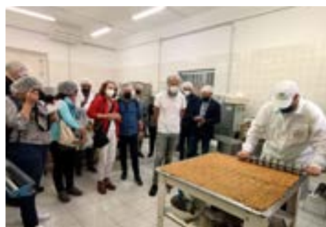
La visita al laboratorio dolciario "Autore Chocolate" di San Marco dei Cavoti (BN), con la preparazione del torrone "croccantino", prestigiosa tradizione locale