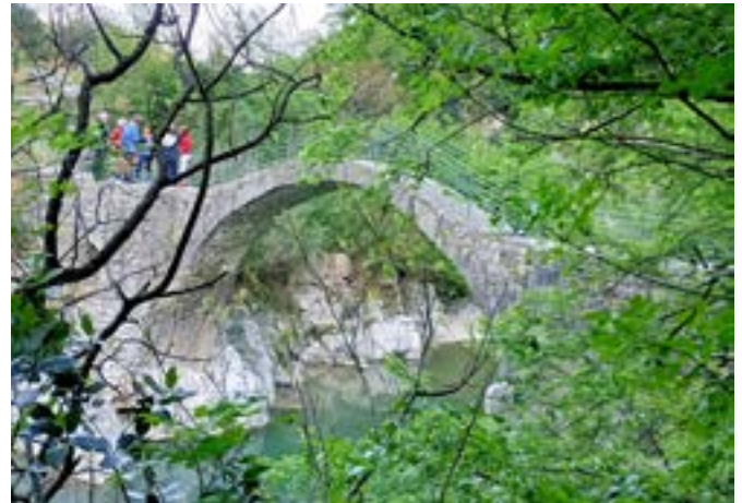
Escursione al ponte di Annibale, nel territorio di Cerreto Sannita (BN)

La mostra archeologica sul Sannio e i sanniti in un 'santuario' della Cultura europea ha avuto il merito di presentare al grande pubblico tedesco ed internazionale le storie e le testimonianze dell'antico Sannio attraverso reperti d'inestimabile valore, non