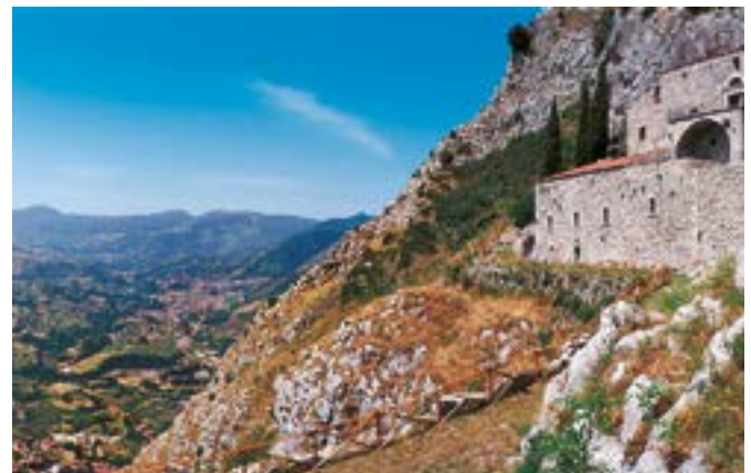
Spettacolare immagine per l'Eremo di San Michele che dal Monte Caurso sul massiccio del Taburno domina l'abitato di Foglianise