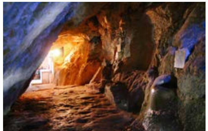
Ancora un particolare della Grotta di San Michele

Dal sagrato San Michele, è preceduto dal vigile urbano, dal crucifero, dal parroco, attorniato dai ministranti, dalla coordinatrice dei canti e delle preghiere, dai questuanti, infine, dai fedeli.