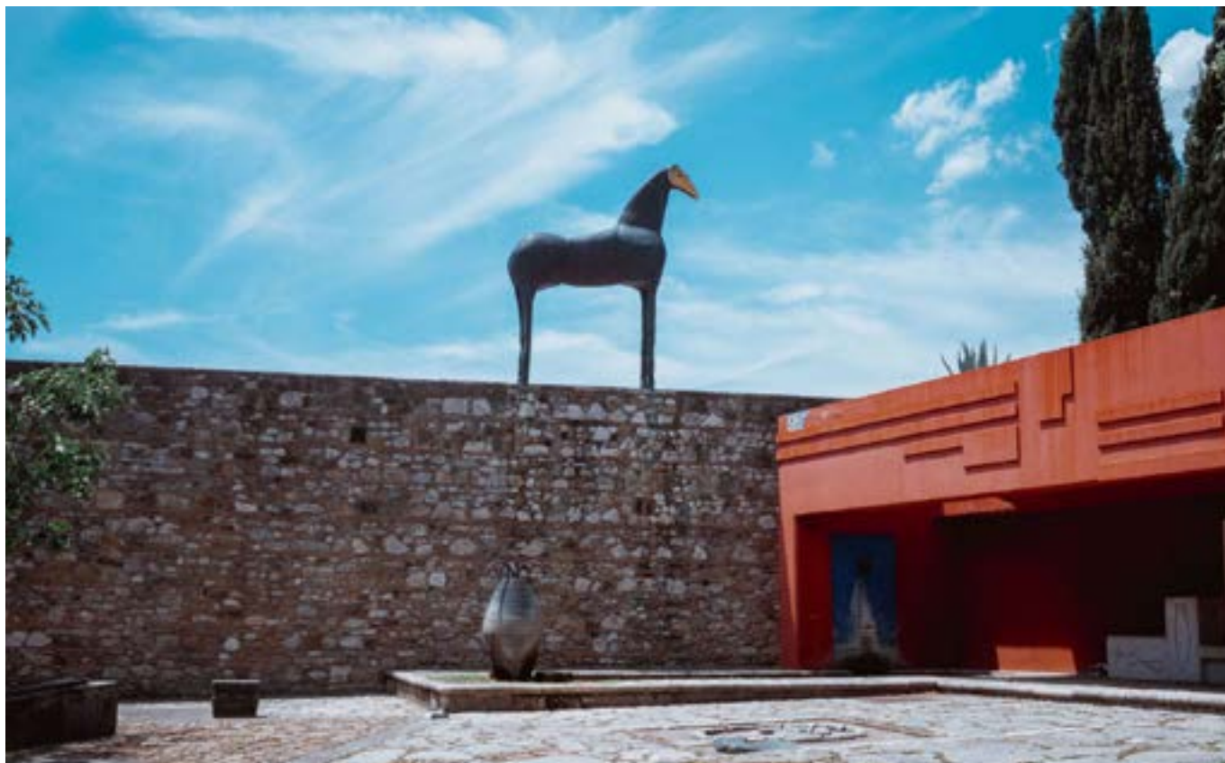
Benevento - Hortus Conclusus di Mimmo Paladino