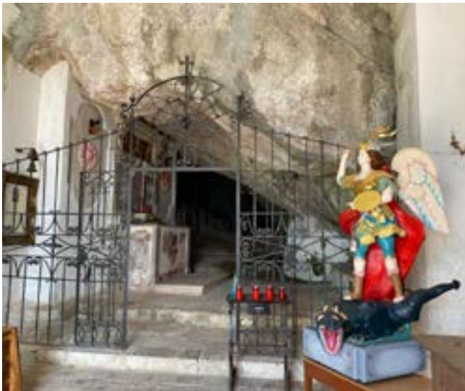
La collocazione della Statua dell'Arcangelo nella Grotta dell'Eremo a lui dedicato sul Monte Caruso a Foglianise

della processione dopo la prima messa, celebrata nella chiesa di Santa Maria di Costantinopoli, l'aria è pervasa dalla festa.