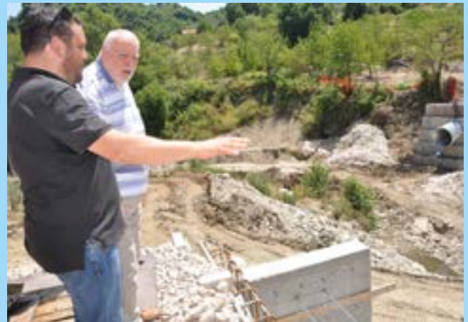
Primavera 2016 - ricostruzione dopo l'alluvione

La Provincia è titolare di una Rete Museale di enorme prestigio e valore che racchiude al proprio interno testimonianze di tremila anni di storia. Dopo la legge 56 non era chiaro chi dovesse occuparsene. In altre Province si giunse alla chiusura di Musei e Pinacoteche non potendo fare diversamente; Ricci invece si assunse la responsabilità di tenere tutto aperto tra