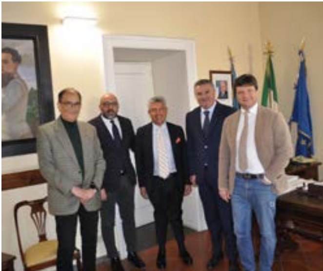
20 febbraio 2023: Nella Sala del Presidente della Provincia di Benevento riunione del Direttivo regionale dell'Unione delle Province campane

Non c'è dubbio che il prelievo forzoso deciso insieme alla legge 56/2014 di decine milioni di Euro dal Bilancio dell'Ente (e complessivamente di 2,3 miliardi di Euro dai Bilanci di tutte le Province) abbia sottratti investimenti al territorio ed alla rete stessa.