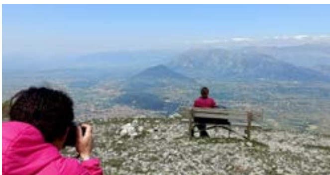
La "terrazza" naturale sulla Valle Telesina, nell'area protetta Taburno - Camposauro