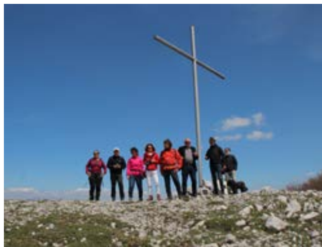
Parco Regionale Taburno Camposauro: escursione con foto di rito sulla vetta più alta (1.394 mt)

tà sul mercato tedesco a produzioni d'eccezione che s'identificano col territorio sannita, quest'anno il Consolato Generale Italiano di Monaco di Baviera ha celebrato la tradizionale cerimonia della Festa della Repubblica nella Glyptothek, l'elegante piazza fatta costruire da Re Ludwig, che oggi ospita il Museo Staatliche Antikensammlungen. Protagonisti del ricevimento... made in Sannio , sono stati i vini autoctoni Aglianico e Falanghina del "Consorzio di Tutela dei Vini del Sannio", i caciocavalli e formaggi tipici del "Caseificio Minicozzi" di Paduli, la salsiccia rossa di Castelpoto della "Fattoria Maio", il guanciale e il salame maialino nero certano del "Salumificio Tomaso" di Faicchio, l' olio extra vergine "Sacrum" della famiglia De Martini di Fragneto l'Abate, i taralli e prodotti da forno di San Lorenzello del "Tarallificio Ricciardi", la mela annurca di Sant'Agata de' Goti dell'Azienda agricola "Bufolino", i torroncini e croccantini firmati "Autore" di San Marco dei Cavoti. Un "paniere" di tipicità, insieme ad altre prelibatezze agroalimentari come pasta, conserve e liquori, che s'identificano col Sannio Beneventano e godono del sigillo di garanzia della piattaforma Web marketing www.eccellenzesannite.it .