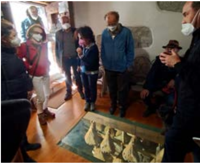
La visita alla prosciutteria di Pietraraja (BN), museo gastronomico di una produzione di eccellenza dell'area del Terno

In qualche modo si è trattato di una riedizione dei tour nel Sannio degli intellettuali Ottocenteschi, come quello di Theodor Mommsen (1817 – 1903).