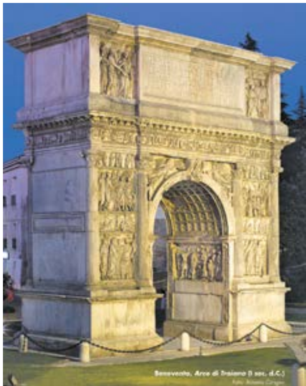
Benevento, Arco di Traiano II sec. d.C.

Il culto del dio Silvano, si trova molto diffuso nei monumenti epigrafici di Benevento e dell'agro beneventano.