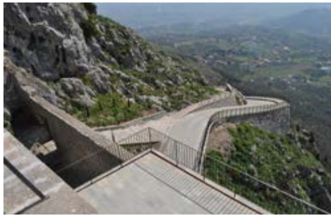
Altra immagine della impervia salita

Altra scoperta importante del monastero è stata quella condot-