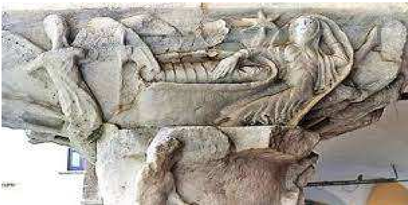
Il pulvino "natività" del Chiostro di Santa Sofia

"La scienza è ciò che comprendiamo abbastanza bene da spiegarla a un computer. L'arte è tutto quanto il resto."